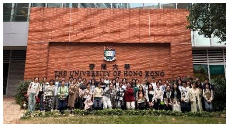
参访交流：香港大学